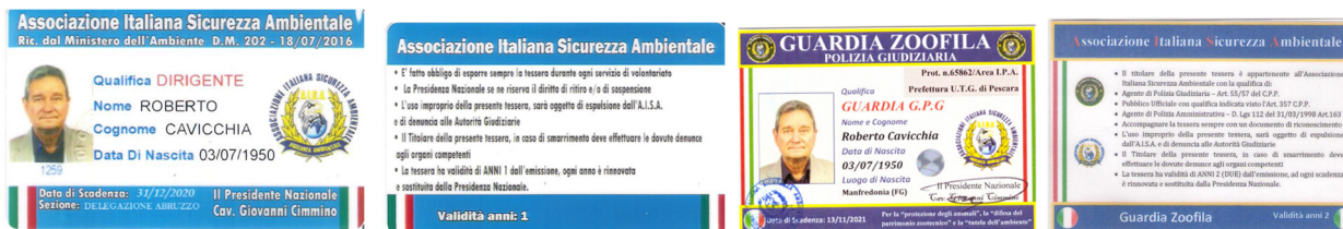
figura a): tesserini in originali nel colore e nella forma, emessi a firma della Presidenza AISA-Nazionale: